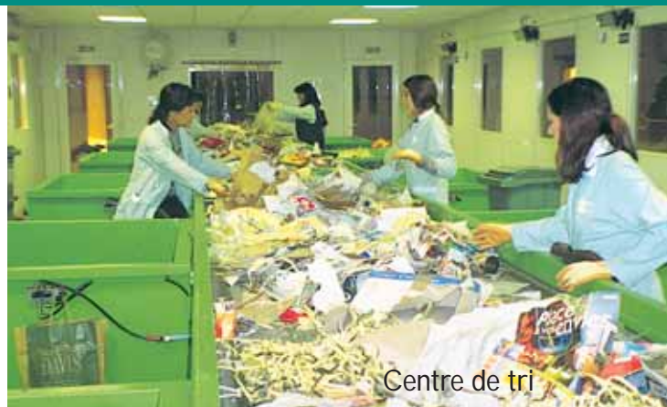
Centre de tri

3 - Il permet la création d'emplois sur la région, notamment avec le centre de tri.